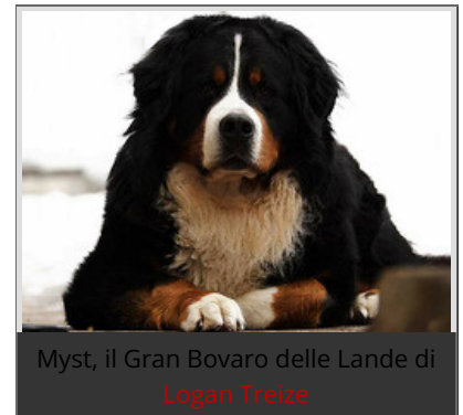
Myst, il Gran Bovaro delle Lande di Logan Treize

Il Vecchio dell'Alpe ha la barba incolta, capelli lunghi, un aspetto un po' rude ed eremitico. Non sembra debilitato ma è un po' curvo.