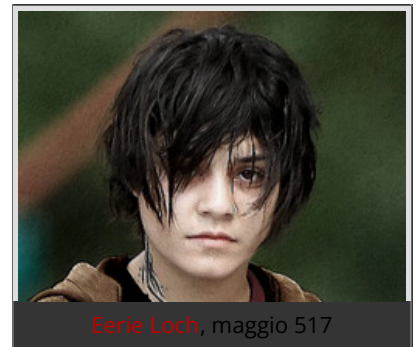
Eerie Loch, maggio 517

Nel pomeriggio Kailah si diverte a sperimentare l'incantesimo Percezione della Magia utilizzando lo zolfo come reagente,