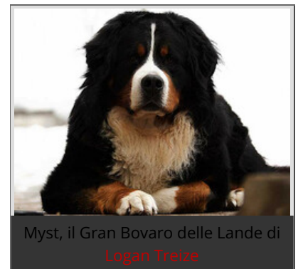
Myst, il Gran Bovaro delle Lande di Logan Treize

Il Vecchio dell'Alpe ha la barba incolta, capelli lunghi, un aspetto un po' rude ed eremitico. Non sembra debilitato ma è un po' curvo.