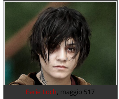
Eerie Loch, maggio 517

Nel pomeriggio Kailah si diverte a sperimentare l'incantesimo Percezione della Magia utilizzando lo zolfo come reagente,