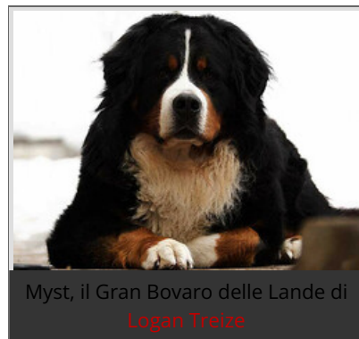
Myst, il Gran Bovaro delle Lande di Logan Treize

Il Vecchio dell'Alpe ha la barba incolta, capelli lunghi, un aspetto un po' rude ed eremitico. Non sembra debilitato ma è un po' curvo.