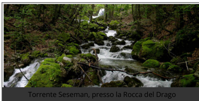
Torrente Seseman, presso la Rocca del Drago

Engelhaft e Colin trovano un buco compatibile con una tana. Bart osserva il buco, annusa e guarda. "Non resta che piazzare una trappola e vedere cosa succede". E la piazza, con tanto di topolino di esca.