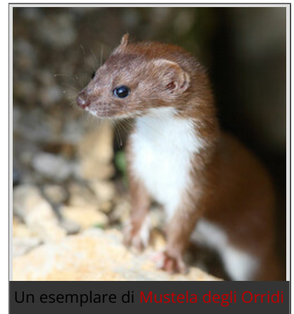
Un esemplare di Mustela degli Orridi

Tutti al villaggio, cena di saluto, col brodo di istrice.