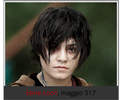
Eerie Loch, maggio 517

Nel pomeriggio Kailah si diverte a sperimentare l'incantesimo Percezione della Magia utilizzando lo zolfo come reagente,