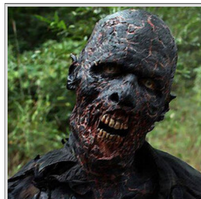
Risvegliato avvistato sul crinale della montagna

La pioggia continua, quindi non si vede e non si sente niente.