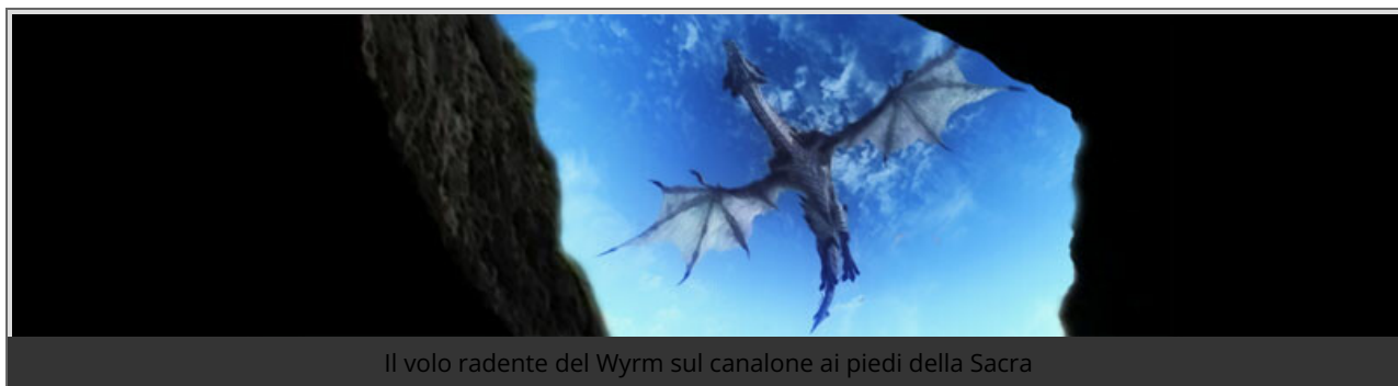
Il volo radente del Wyrm sul canalone ai piedi della Sacra

"E' la prima volta da quando stiamo qui che abbiamo la certezza che gli Dei sono con noi" commenta Bohemond.